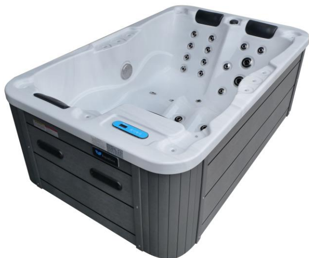
Acrílico Blanco Mármol / Mueble Gris